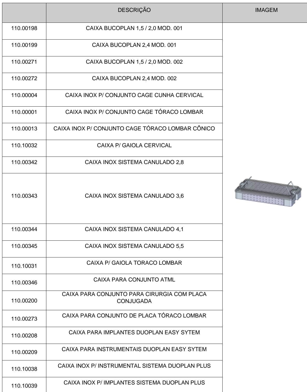
Tabela: Apresentação das Caixas Cirúrgicas em Aço Inox Engimplan